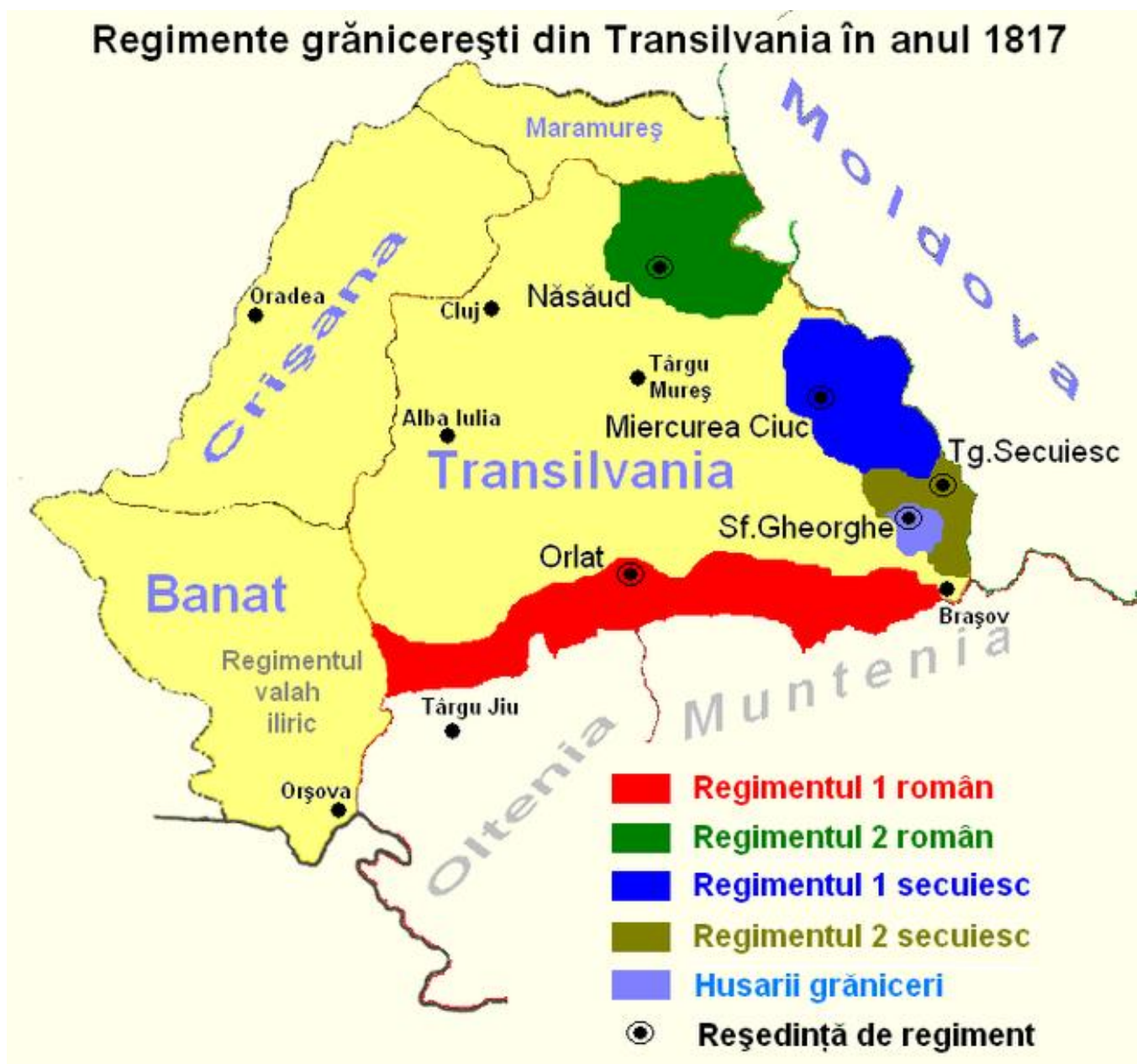
Carte no. 1 Les regiments de garde-frontiere du Transylvanie

Le siège du régiment a été établi dans la localité de Năsăud qui est situé dans la partie de sud-ouest de la zone militarisée, étant le plus important établissement humain dans la région. Ici se trouve également le domicile permanent du commandant du régiment, l'état-major ainsi que les bureaux administratifs officiels. Les luttes 34 auxquelles les soldats du régiment ont participé qui ont eu lieu pendant les années 35 1779, 1788, 1790, 1796, 1848-1849, couronnées de victoires glorieuses, ont été dirigées par des généraux qui ont eu leur