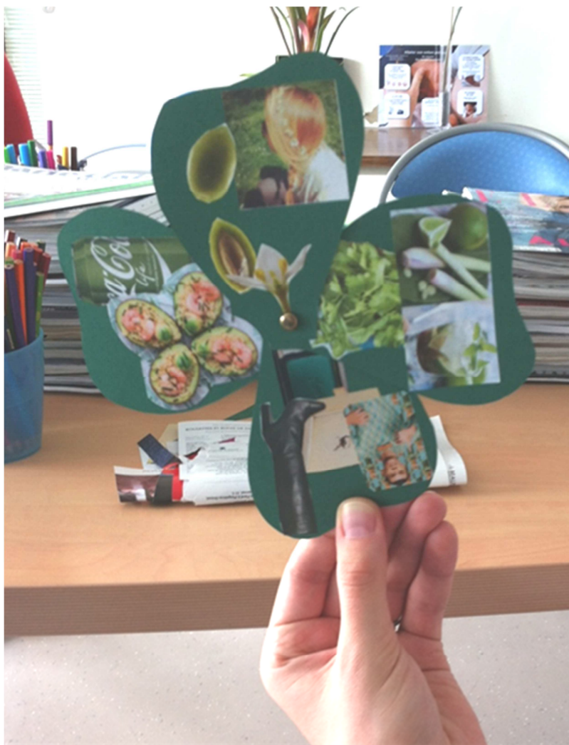
« Se mettre au vert »