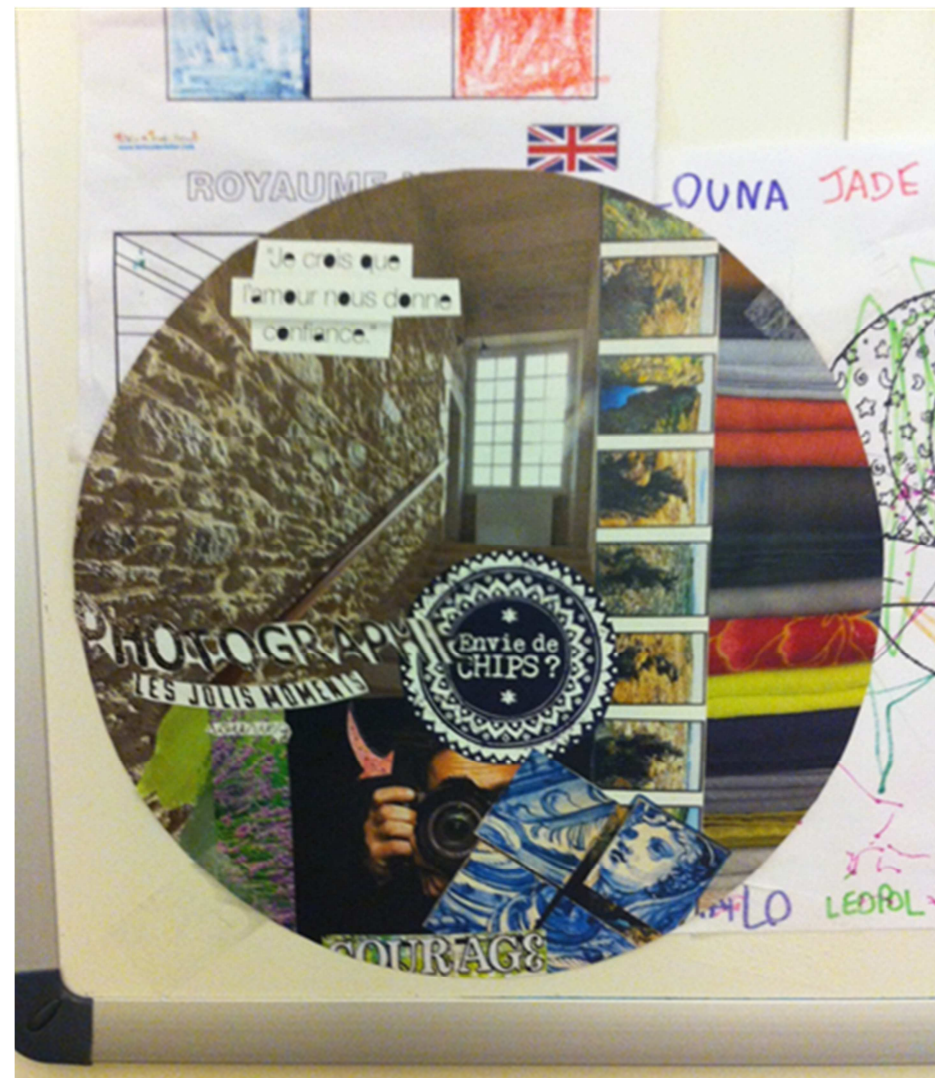
Autour de soi