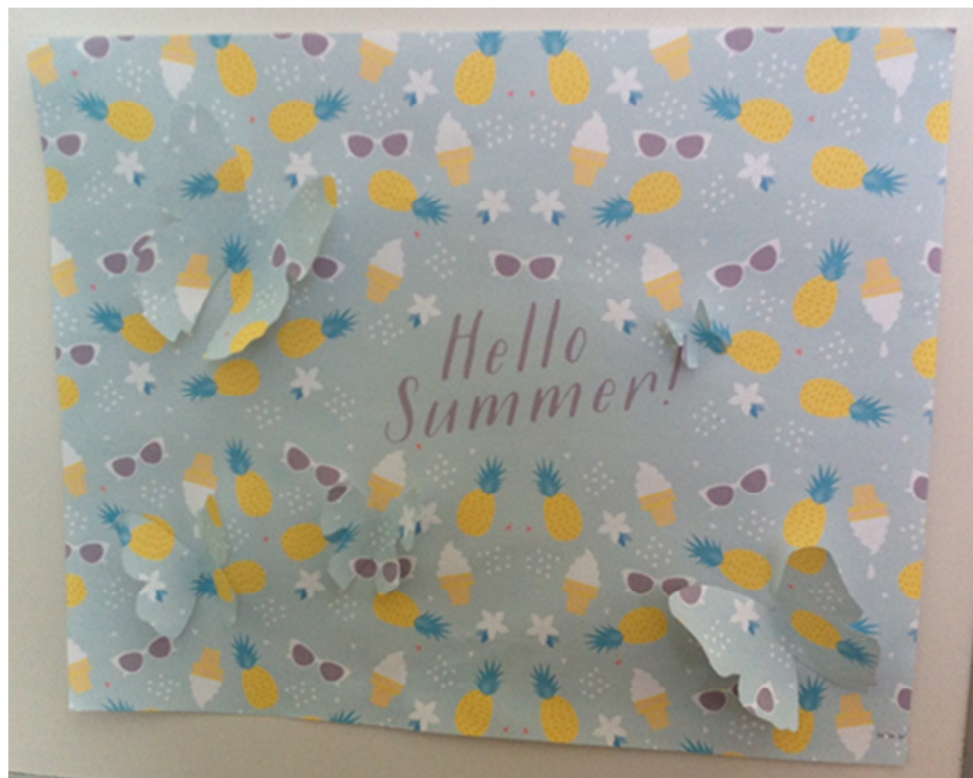
Trompe-l'œil « papillons »