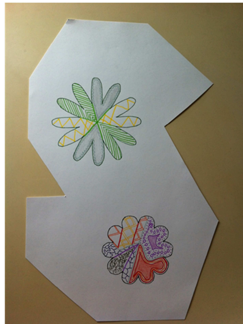
Forme à choisir et remplir