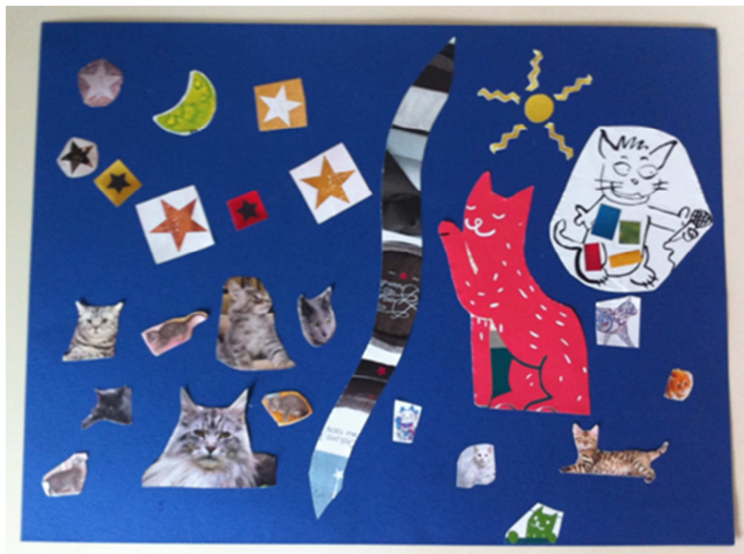
« La nuit tous les chats sont gris »