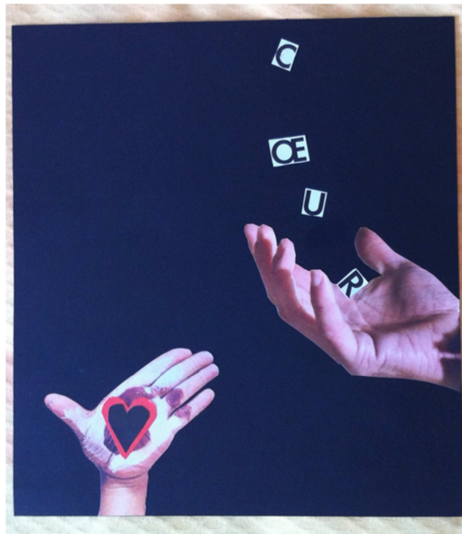
« Avoir le cœur dans la main »